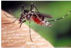
Aedes aegypti Aedes albopictus